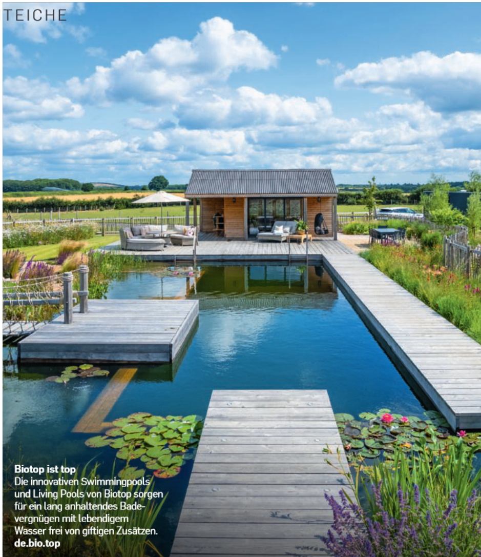
Biotop ist top Die innovativen Swimmingpools und Living Pools von Biotop sorgen für ein lang anhaltendes Badevergnügen mit lebendigem Wasser frei von giftigen Zusätzen. de.bio.top