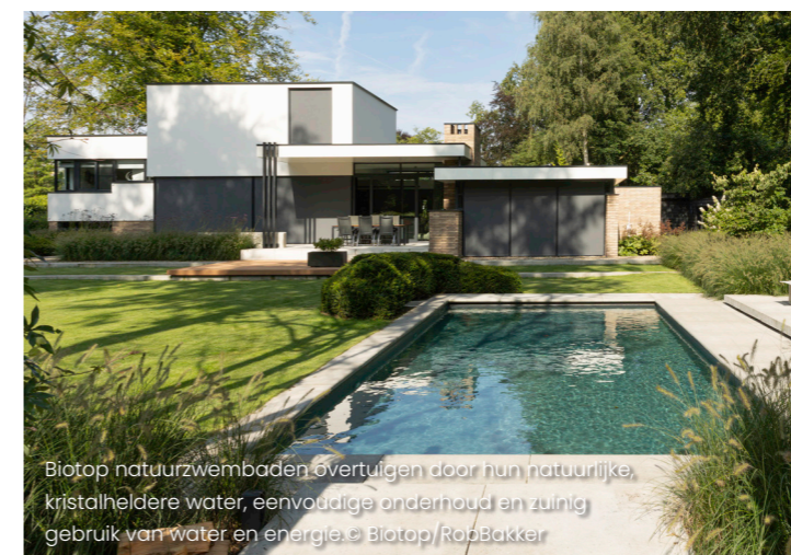
Biotop natuurswembaden overtuigen door hun natuurlijke, kristalheldere water, eenvoudige onderhoud en zuinig gebruik van water en energie

Of het nu gaat om het design of de grootte - een Biotop natuurswembad of zwemvijver kan worden aangepast aan uw persoonlijke wensen. De Living Pool, met zijn heldere architectuur en compacte design, is ideaal voor wie houdt van moderne esthetiek en efficiënt ruimtegebruik. Daarentegen nodigt de Swimming Pond uit tot een onderdompeling in de natuur, waar een rijke verscheidenheid aan planten en dieren een levendig ecosysteem vormt. Maar ook in de winter blijft een zwemvijver aantrekkelijk - bijvoorbeeld als verfrissend dompelpad na een sauna. Aangevuld met praktische accessoires zoals oprolbare afdekkingen, verlichting of zwembadrobots kan een zwemparadijs op maat worden gecreëerd.