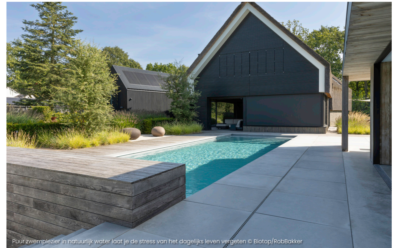
Puur zwemplezier in natuurlijk water laat je de stress van het dagelijks leven vergeten