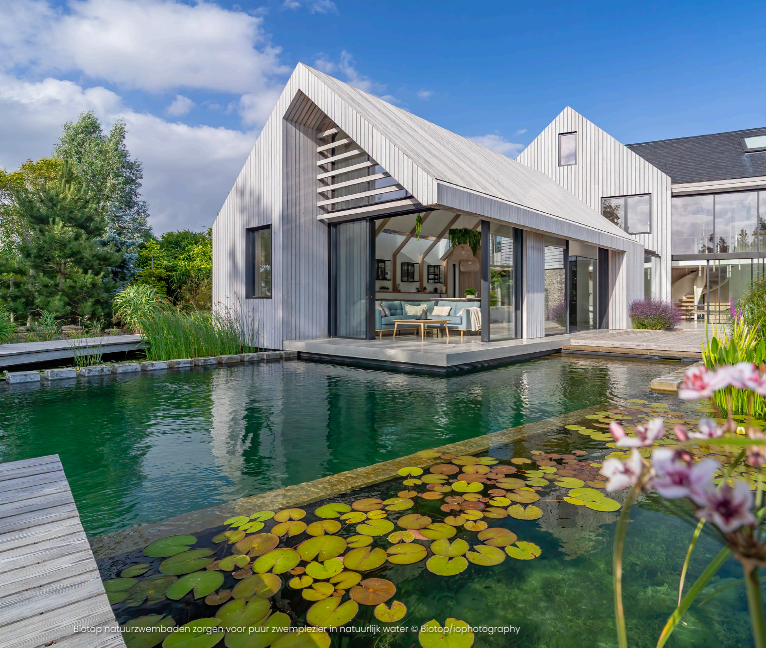
Biotop natuurswembaden zorgen voor puur zwemplezier in natuurlijk water